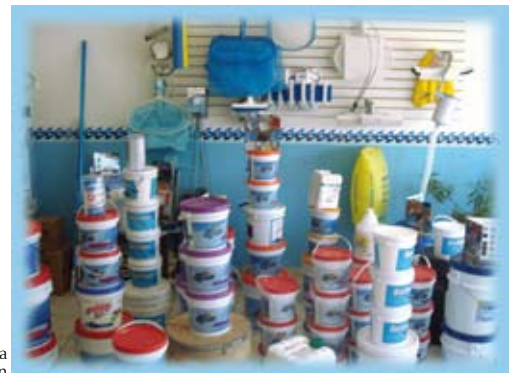
Interior de la exhibición